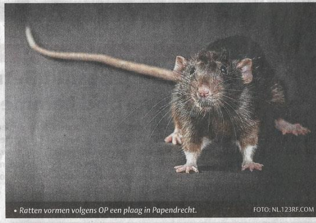
• Ratten vormen volgens OP een plaag in Papendrecht.

De partij wil graag per kwartaal op de hoogte gehouden worden van klachten en de probleemoplossing door de gemeente. "Worden er eventueel extra mensen ingehuurd om de ratten te bestrijden?"