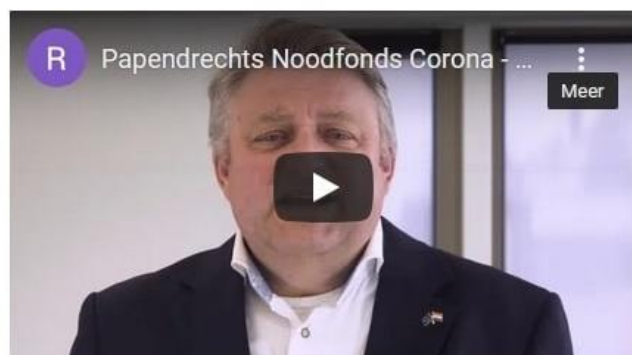
Videoboodschap Papendrechts Noodfonds Corona

OP heeft moties om de plaatselijke horeca te steunen ingediend en de komst van een Papendrechts Noodfonds Corona bepleit.