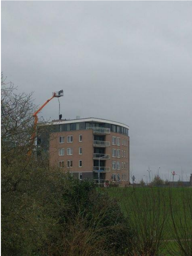
Figuur 1 plaatsing 5G zendmast Westeind

Er is iets aan de hand: we krijgen steeds meer informatie die tot het inzicht leidt dat de Nederlandse Staat onrechtmatig handelt omdat zij burgers niet beschermt tegen de gevaarlijke gevolgen van blootstelling aan elektromagnetische velden van 5G. Deze verplichting ligt vast in de wet. De overheid slaat alle waarschuwingen in de wind. De afgelopen jaren is meer bewustzijn over de schadelijke gevolgen van Elektromagnetische Velden (EMV) ontstaan, die schade toebrengt aan mens, dier en leefmilieu.