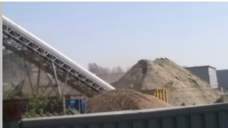
Figuur 1 Stuifzand waait van de zandberg

34. Bent u bereid te eisen van het bedrijf in kwestie dat de opslagbergen 24 uur per dag 7 dagen per week natgehouden zullen gaan worden? Kunt u nog eens aangeven waaruit de sproei-installatie bestaat waarmee de opslagbergen nat gehouden zullen gaan worden? Graag uw nadere toelichting.